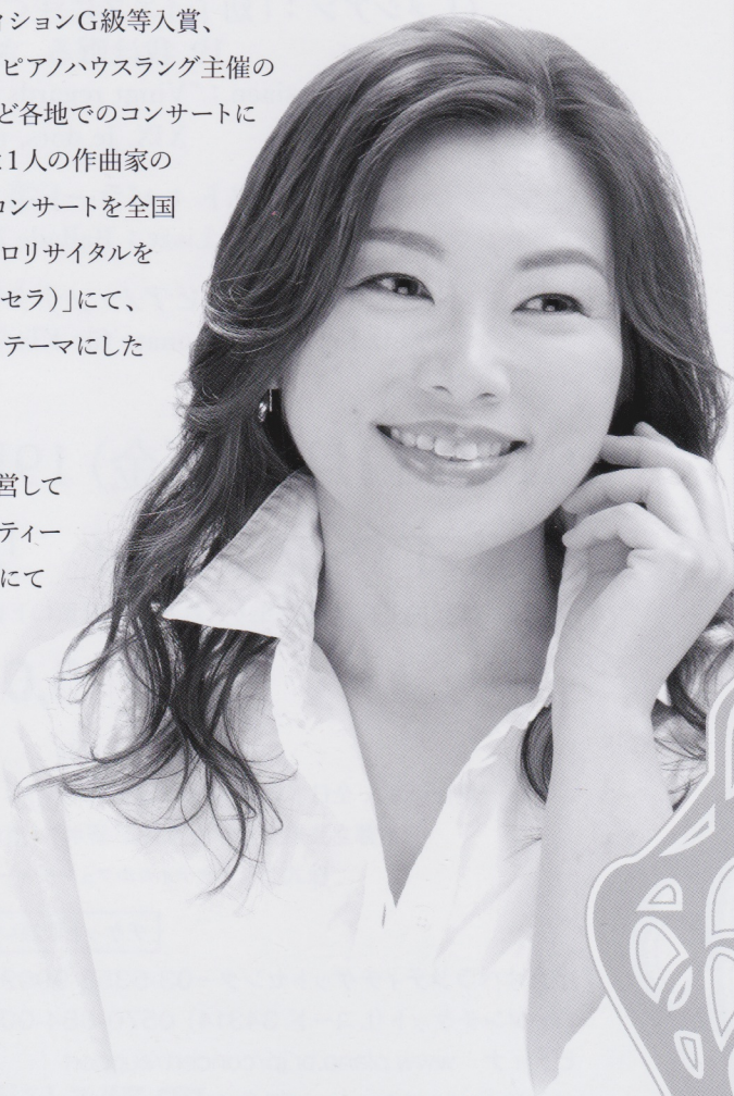
Hair & Make-up : Miki Kato (Studio☆DIVA)